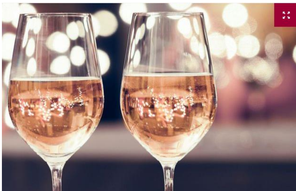
Calici di Stelle con i grandi vini italiani nella notte di San Lorenzo

Dal brindisi con il Nobile immersi nel Rinascimento a Montepulciano, con una degustazione nello scenario unico di Piazza Grande con lo spettacolo degli sbandieratori del Bravio delle Botti e cene nelle sue Contrade, a quello per i 50 di Doc del Verdicchio dei Castelli di Jesi e del Rosso Piceno a "Marche in Vino Veritas", evento promosso ad Offida, tra convegni, degustazioni e grandi chef, dall'Istituto Marchigiano